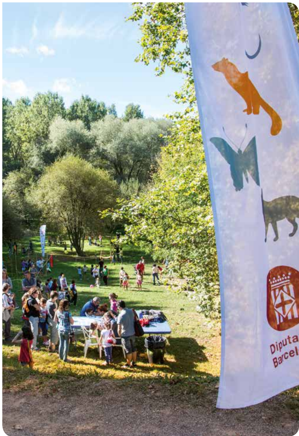
Eduard Pedrocchi (Taller de Cultura)