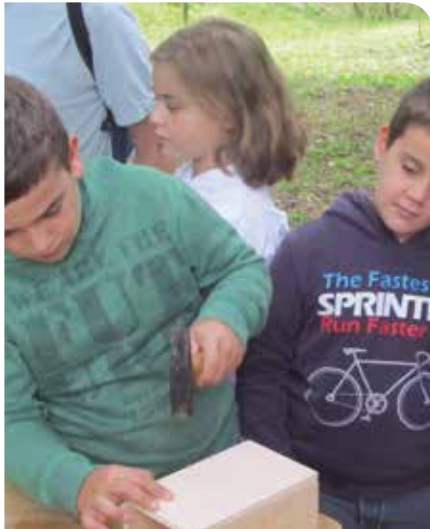
Jordi Hernández (Arxiu XPN)