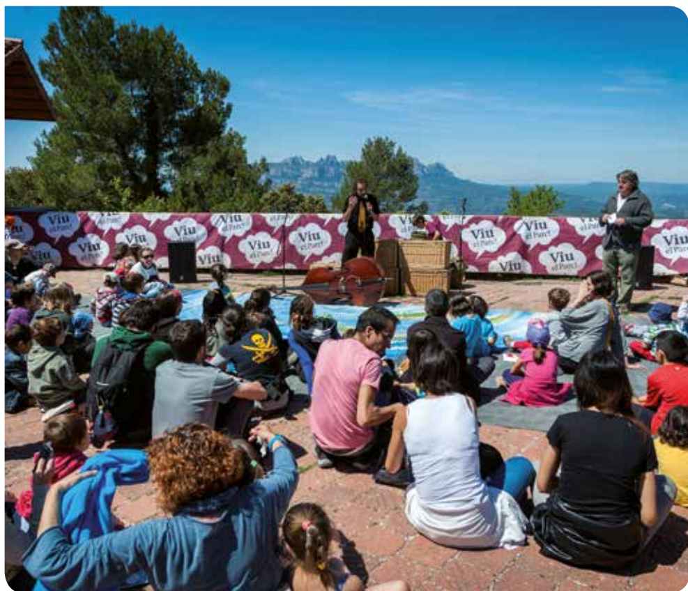
© Eduard Pedrocchi (Taller de Cultura)