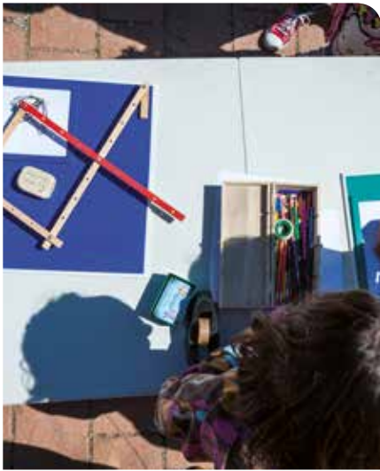
© Eduard Pedrocchi (Taller de Cultura)