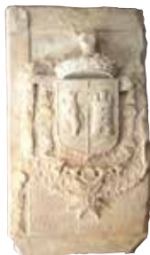
Lauda sepulcral del marquès de Besora

Arnau Guillem de Besora va ser el primer personatge de la seva nissaga que va habitar al castell. A partir d'aquell moment l'antic casalot va esdevenir un lloc de residència habitual.