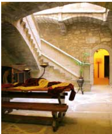
Escala noble del castell incorporada durant les obres del 1917 i 1920.

Avui dia el castell de Montesquiú recupera el lligam amb el territori i s'integra al parc.