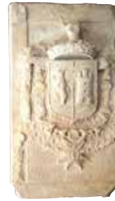
Lauda sepulcral del marquès de Besora

Arnau Guillem de Besora va ser el primer personatge de la seva nissaga que va habitar al castell. A partir d'aquell moment l'antic casalot va esdevenir un lloc de residència habitual.