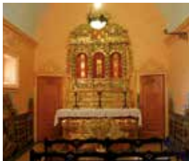
Capella del castell