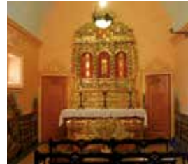
Capella del castell