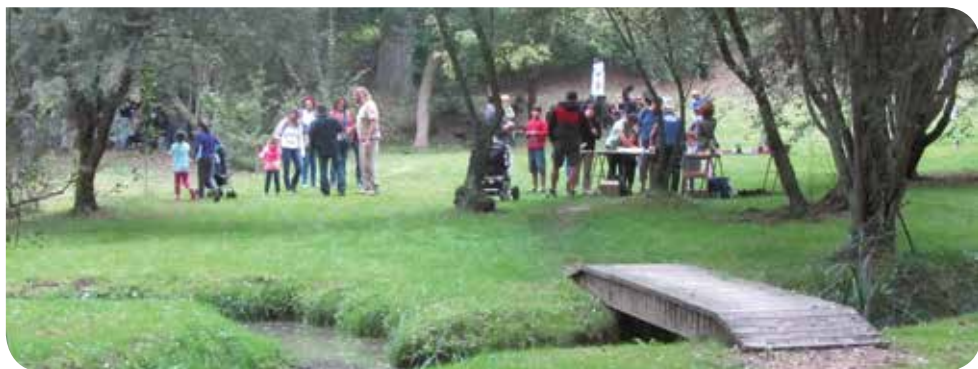
J. Hernández (Arxiu XPN)

20.30 h Castanyada popular a la plaça Major. L'organitza: Els Camarrosos Més informació: vilanovas@diba.cat