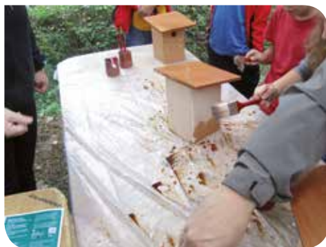
J. Hernández (Arxiu XPN)