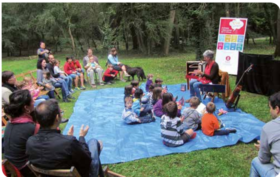
J. Hernández (Arxiu XPN)

15.30 h Aplec de Sant Andreu de Bancells a l'església de Sant Andreu de Bancells. L'organitza: Veïns de Vilanova i Sant Hilari Sacalm. Més informació: vilanova@diba.cat