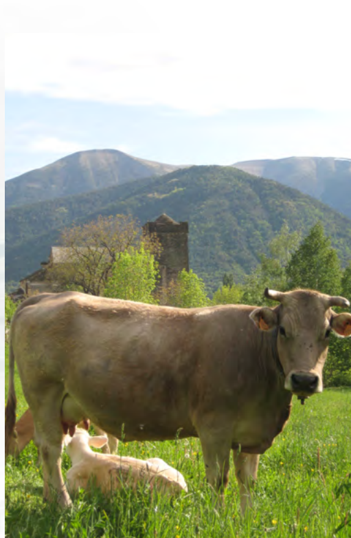
Raza autóctona certificada

Todos los asistentes se mostraron muy ilusionados por la propuesta y creen que puede suponer un importante impulso para el desarrollo socioeconómico de esta zona, puesto que los valores que representa la Reserva son compartidos por todos ellos y por un número cada vez mayor de visitantes que demandan un aprovechamiento y disfrute de los recursos y productos de este territorio, donde los intereses del hombre y la naturaleza deben desarrollarse de forma armónica y sostenible.