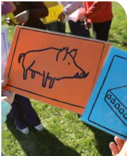
J. Melero (Arxiu XPN)