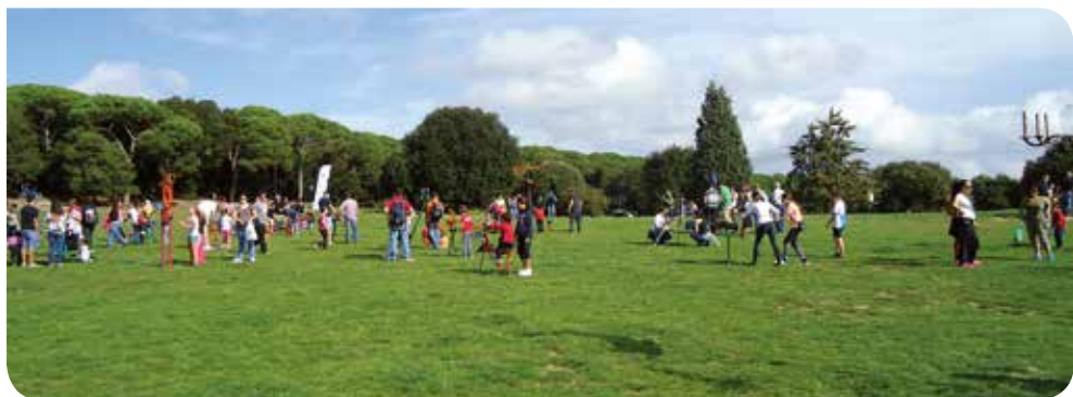
J. Hernández (Arxiu XPN)

Viu el parc és una magnífica oportunitat per descobrir tot els vessants del Parc del Montnegre i el Corredor, així com tot el seu ric patrimoni natural i cultural. Vine a viure la màgia dels parcs naturals!