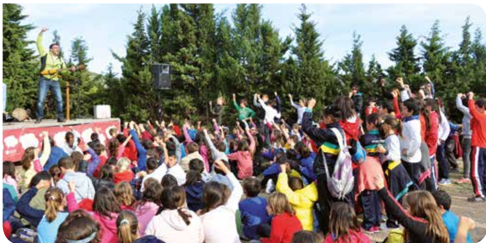
J. Meleró (Arxiu XPN)

11 h Visita guiada: Ruta dels refugis . Punt de trobada al Centre d'Informació del Castell de Penyaafort. Preu: adults, 5 euros; menors de 12 anys, gratuït; tarifa reduïda, 2 euros. Informació i reserves: 669 287 539, turisme@smmonjos.cat. Durada aproximada: 2 h