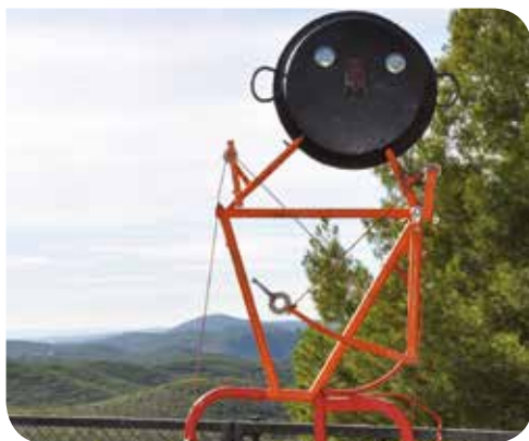
J. Meiero (Arxiu XPN)

L'organitza: Centre Cultural i Recreatiu de Cantallops