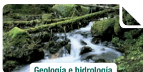
Geología e hidrología