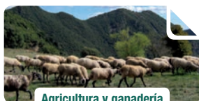
Agricultura y ganadería