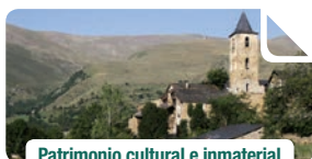
Patrimonio cultural e inmaterial