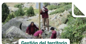
Gestión del territorio