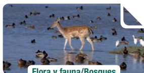
Flora y fauna/Bosques