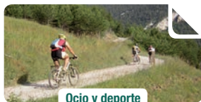
Ocio y deporte