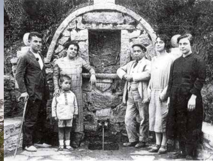
© Font de Planeses (c.1925). Foto cedida a l'Arxiu Històric de Montesquiu per Nativitat Muñoz García