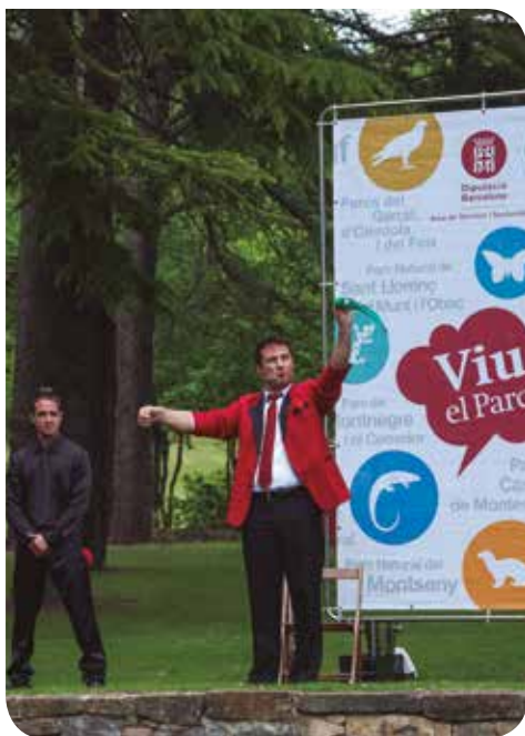
© Eduard Pedrocchi (Taller de Cultura)