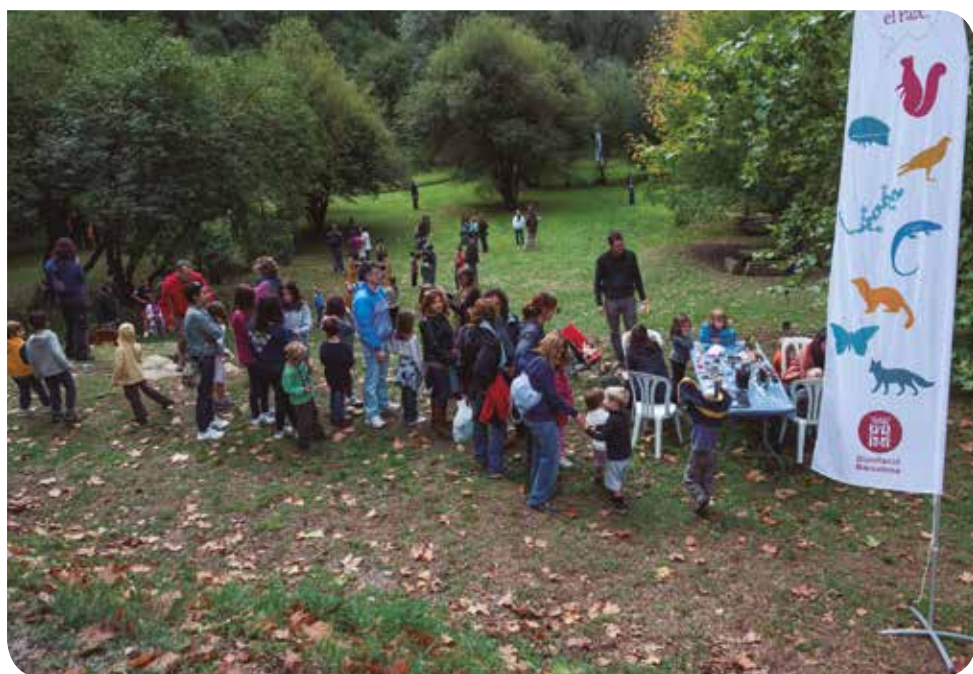
Pep Herrero (Taller de Cultura)