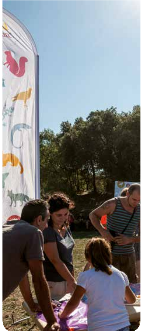
© Pep Herrero (Taller de Cultura)