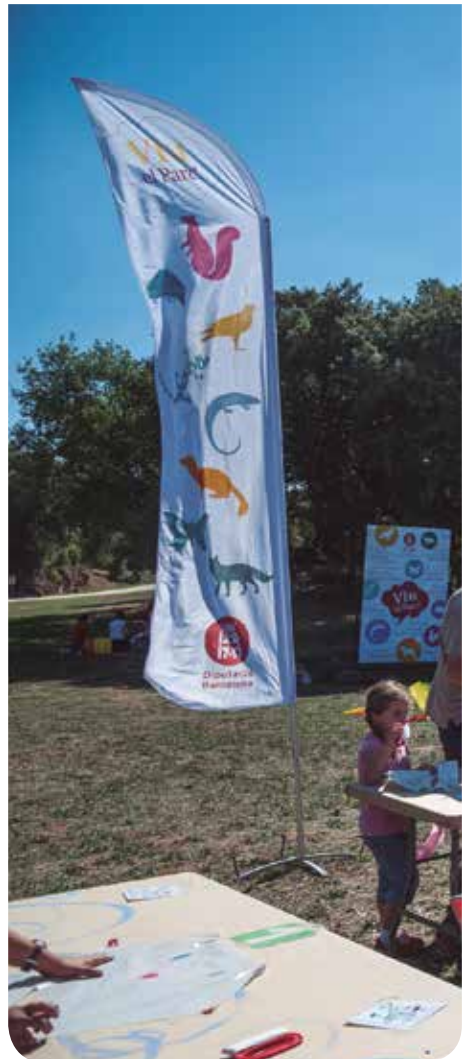
© Pep Herrero (Taller de Cultura)