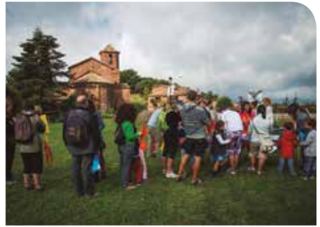
© Eduard Pedrocchi (Taller de Cultura) / DIBA

Servei de Medi Ambient Pujada de Sant Martí, 5 17004 Girona Tel. 972 185 000 medi.ambient@ddgi.cat