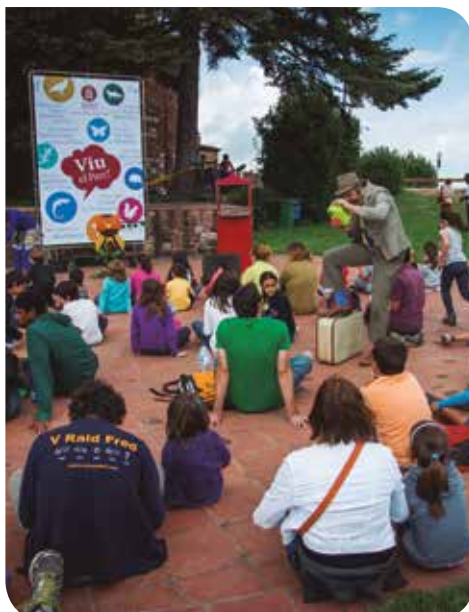
© Eduard Pedrocchi (Taller de Cultura) / DIBA