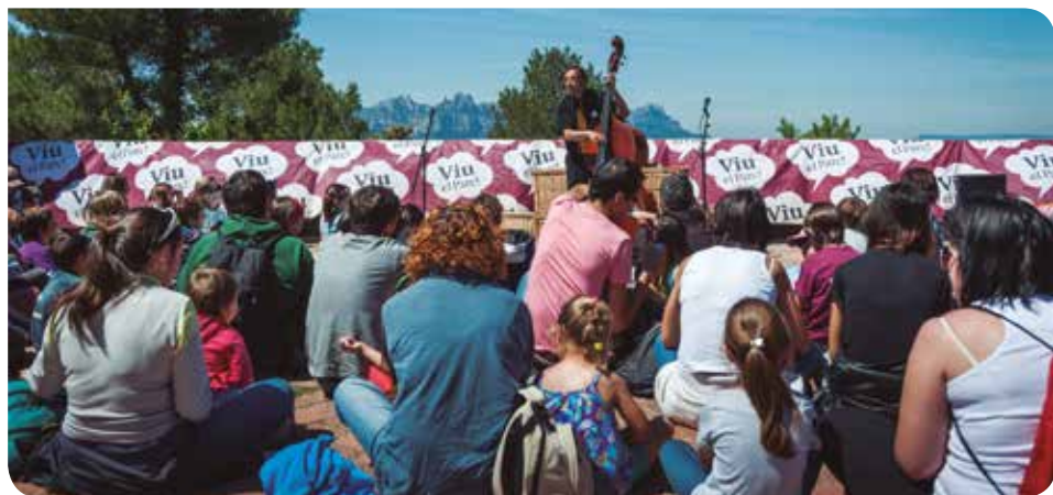
© Eduard Pedrocchi (Taller de Cultura)

22 h Concert de sardanes i música popular, amb la Cobla Jovenívola de Sabadell , al parc de les Escoles Velles