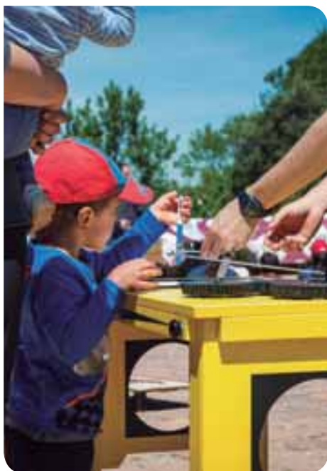
Taller de Cultura

Romero-Fo , a la sala d'actes del Casal de Cultura