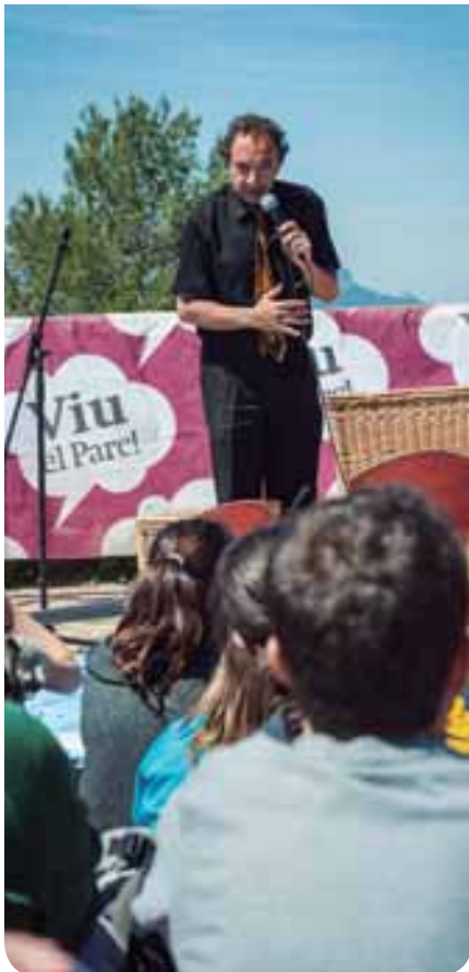
© Eduard Pedrocchi (Taller de Cultura)