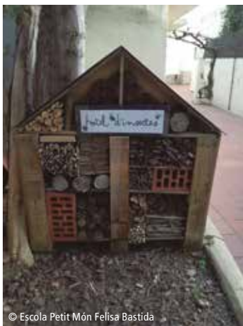
© Escola Petit Món Felisa Bastida

Farem el nostre hotel d'insectes amb materials reciclats o reutilitzats. Coneixerem la pol·linització i aprendrem a valorar el paper dels insectes dins dels ecosistemes. Cal portar un recipient metàl·lic o de plàstic (llauna d'olives gran, pot de cacau...).