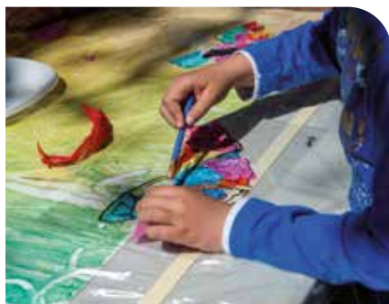
Pep Herrero (Taller de Cultura)