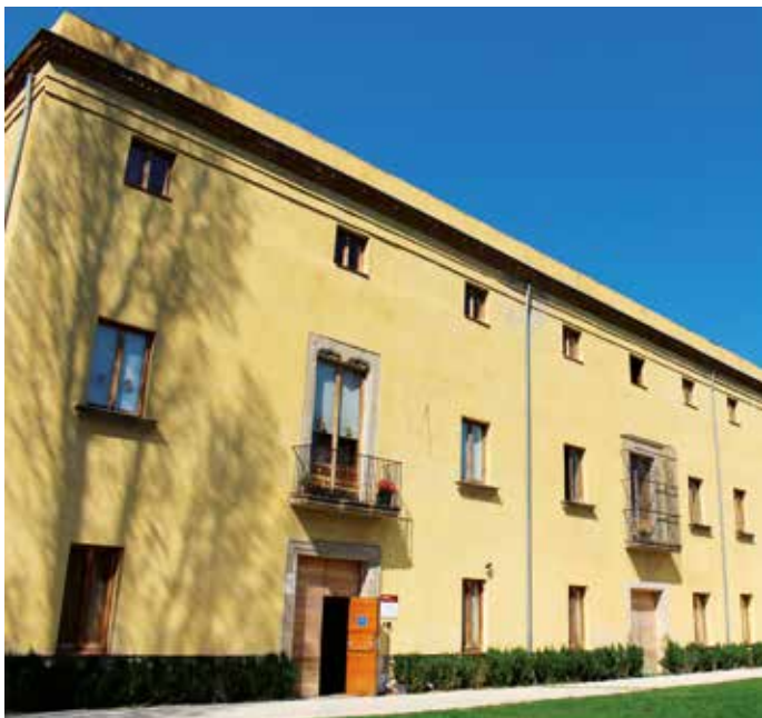
© Parc pel Campus de l'Alimentació. Universitat de Barcelona