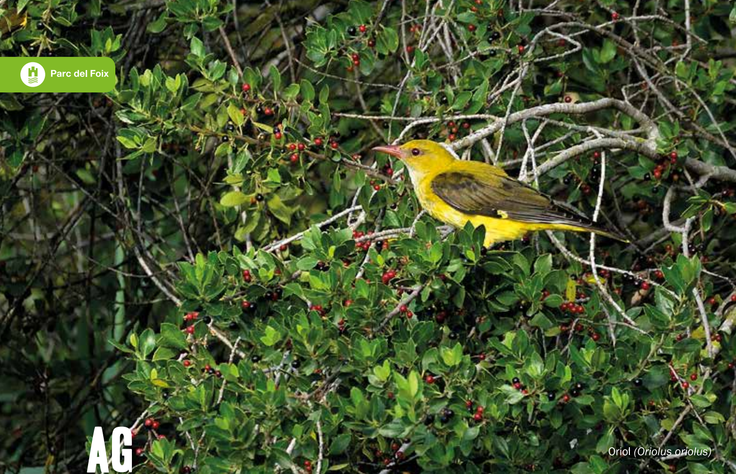
Oriol ( Oriolus oriolus )