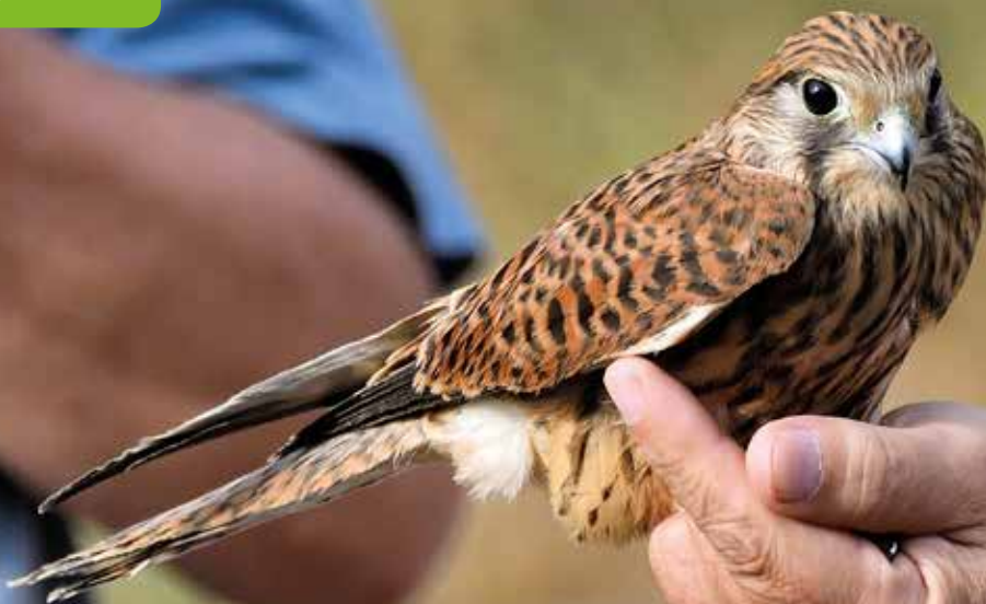
Xoriguer comú ( Falco tinnunculus )