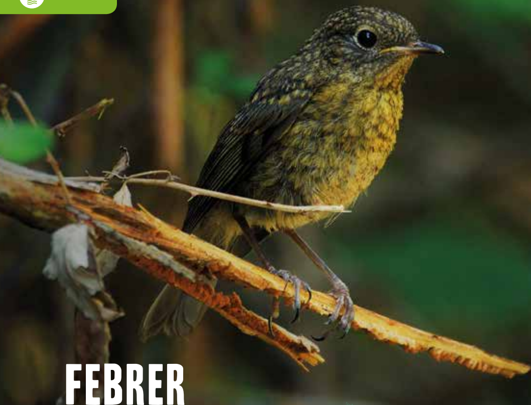
Pit-roig ( Erithacus rubecula )