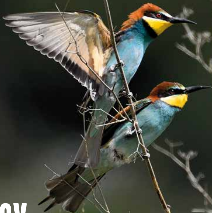
Abellerol ( Merops apiaster )