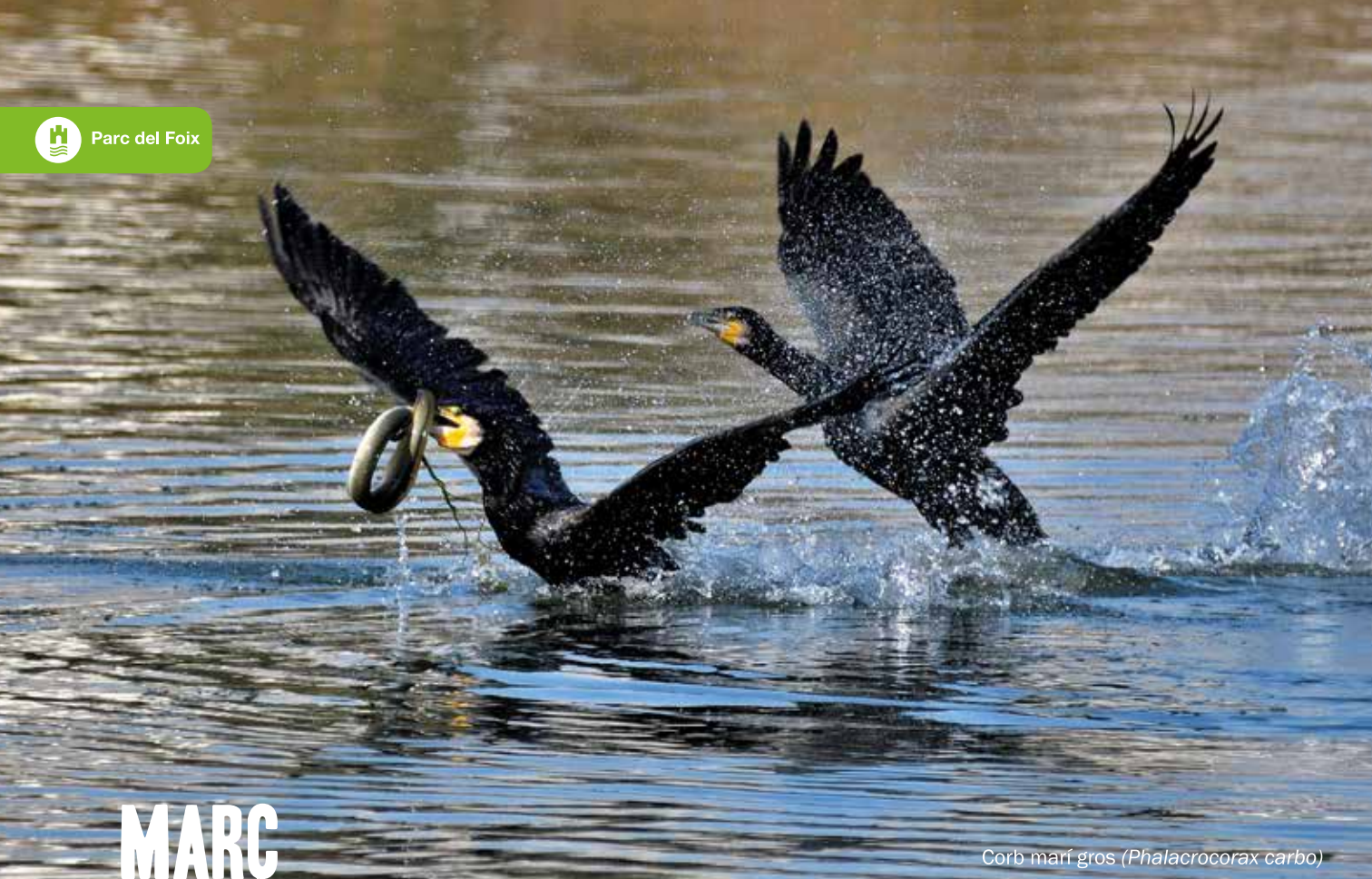
Corb marí gros ( Phalacrocorax carbo )