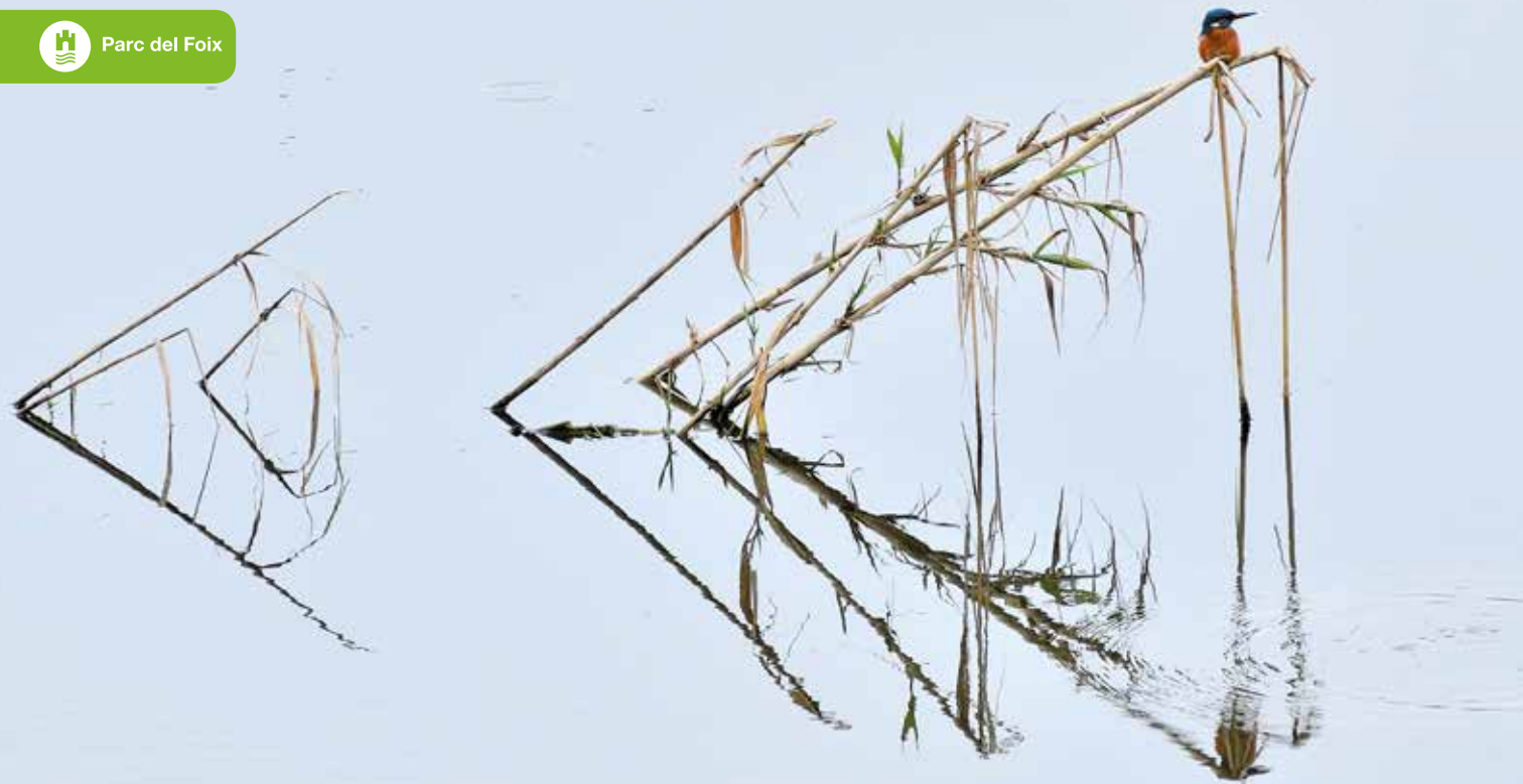
Blauet ( Alcedo atthis )