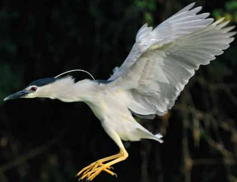
Martinet de nit ( Nycticorax nycticorax )