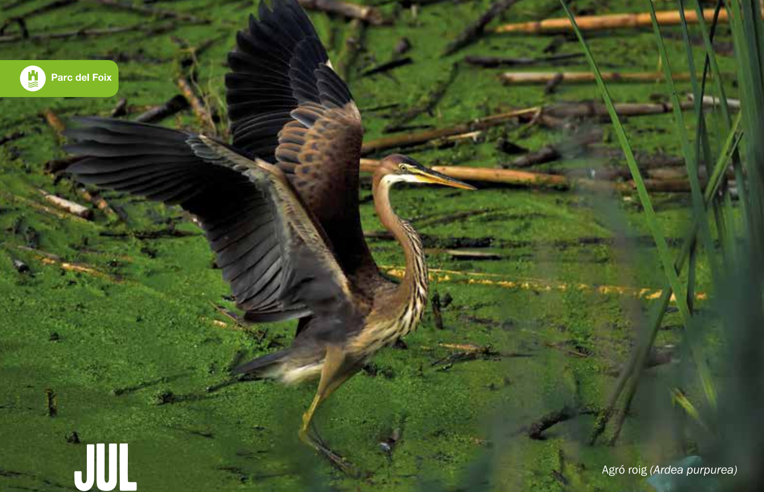
Agró roig ( Ardea purpurea )