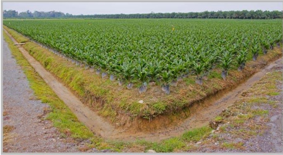
Camp colombià de Palma

Parlem d'economia sostenible. En els seus orígens desenvolupament sostenible es considerava aquell desenvolupament que satisfà les necessitats de les generacions presents sense comprometre les possibilitats de les generacions futures per a tal que puguin atendre les seves pròpies necessitats (Declaració de Rio, 1992).