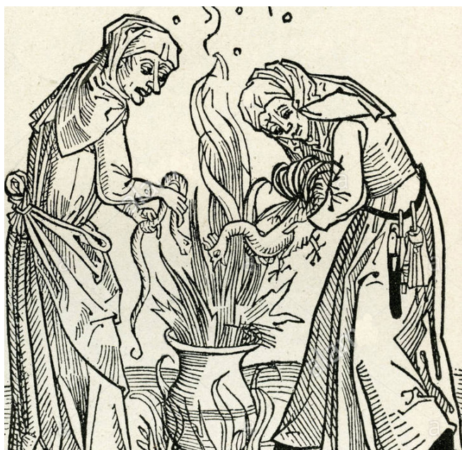
Xilografia de l'any 1508, extreta del tractat sobre bruixeria De Lamiis et Pythonicis Mulieribus escrit per Ulrich Molitor.