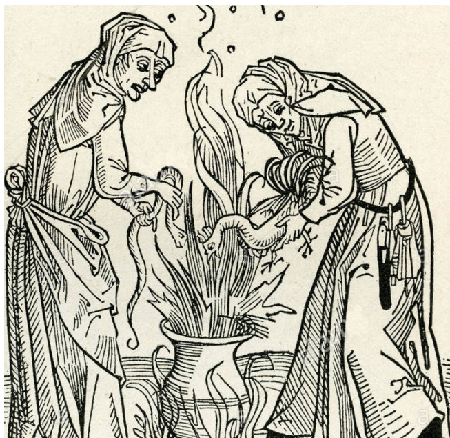
Xilografia de l'any 1508, extreta del tractat sobre bruixeria De Lamiis et Pythonicis Mulieribus escrit per Ulrich Molitor.