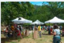
2a ed. de 'La primavera a la Serralada de Marina' a Badalona