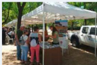
2a Festa del Medi Ambient de Santa Coloma de Gramenet