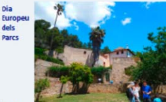
Dia Europeu dels Parcs