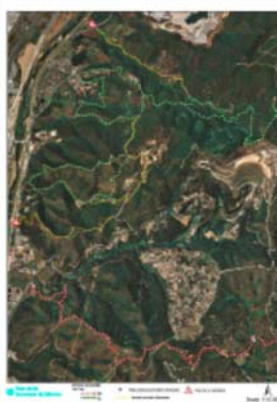
Redisseny del traçat dels itineraris del parc a Montcada i Reixac