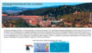
1 any de dades a la web cam d'Ecometta