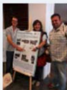
Participació al Fòrum Europeu sobre Boscos Urbans