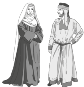
Gombau de Besora i Ermessenda de Carcassona, protagonistes de l'alta edat mitjana

La torre de defensa sobre el riu Ter s'alça sota la mirada vigilant del gran castell de Besora.