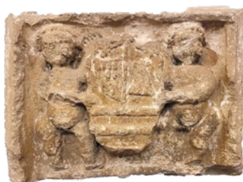
Escut dels Besora