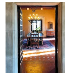
Sales nobles del castell

Els temps canvien, la noblesa dona pas a una burgesia comercial i industrial poderosa. El castell de Montesquiú, caprici i dispendi dels hereus Juncadella.