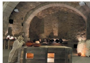
Escenografia medieval a la sala del celler

El feudalisme al Bisaura consolida els Besora com a grans senyors d'un sistema que sotmet els pagesos sota el seu poder.