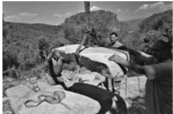
Figura 8. Restitució de la coberta del dolmen de Ca l'Arenes.

nou. Immediatament es falcaven amb pedres petites i es consolidaven amb morter de calç. Aquest procés es va iniciar en el lateral oest, per continuar amb l'est i finalitzar amb les lloses que feien de brancal de l'entrada. Una vegada enllestida la cambra, es van restituir al seu lloc les dues lloses de paviment del seu interior, que es van