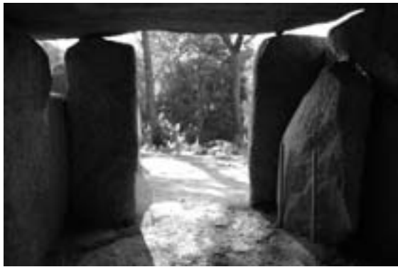
Figura 10. Dolmen de Ca l'Arenes des de l'interior, amb la llosa porta a la dreta.