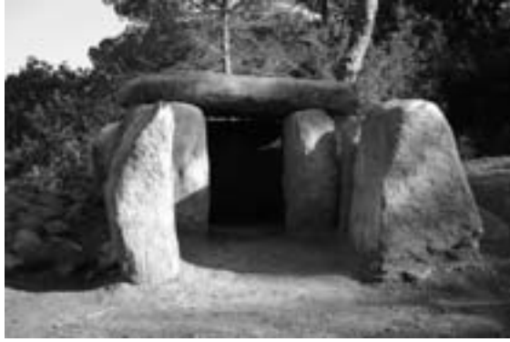
Figura 9. Vista frontal del dolmen de Ca l'Arenes una vegada finalitzada la restauració.