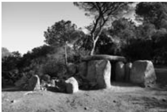
Figura 11. Dolmen de Ca l'Arenes amb el túmul a primer terme després de la restauració.

enganxar amb morter de calç, ja que estaven trencades.