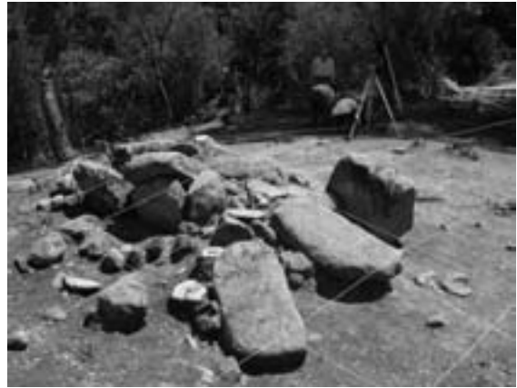
Figura 6. Dolmen de Ca l'Arenes a l'inici de l'excavació.

La fase de restauració es va iniciar per les lloses laterals de la cambra. Aquestes es trobaven tan inclinades i basculades que es va fer del tot necessari aixecar cada pedra amb l'ajut de maquinària pesada per tal de deixar-les dretes de