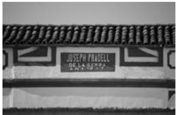
Figura 2. Esgrafiat de la façana de Can Pradell de la Serra.

va succeir, ja feia molts anys que s'havien publicat monuments megalítics d'altres països, de manera que alguns autors parlaven de Catalunya com un indret on no se n'havien construït mai. El menhir de la Pedra del Diable de Pau (Garrotxa) es donà a conèixer l'any 1872, així com també, durant el mateix any i en una altra publicació, el dolmen de Senterada (Pallars Jussà) esmentat per Moner (SANPERE i MIQUEL, 1881); es tractava dels primers monuments megalítics descrits del Principat. Dins del grup megalític del Maresme-Vallès Oriental, el dolmen de la Pedra Gentil de Vallgorguina es va publicar per primera vegada l'any 1878, mentre que els propers monuments megalítics de Pedra Arca (Vilalba Sasserra) i de Pins Rosers (Cardedeu) es van publicar al seu torn l'any 1879. Aquests vestigis del Vallès Oriental s'inclouen dins dels primers monuments megalítics