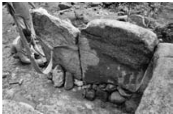
Figura 7. Restauració de la cambra funerària del dolmen de Ca l'Arenes.