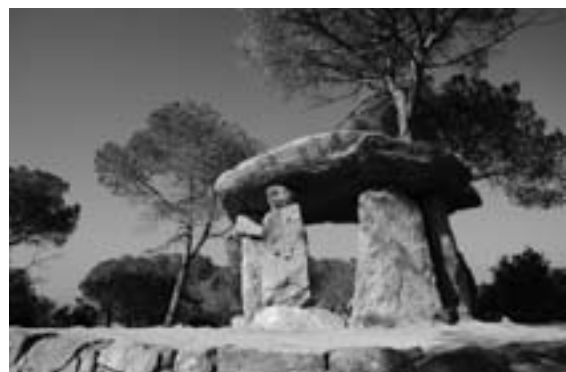
Figura 5. Dolmen de Pedra Gentil (Vallgorguina).

Avui dia el dolmen no respon a cap tipologia coneguda i no podem saber quin aspecte tenia