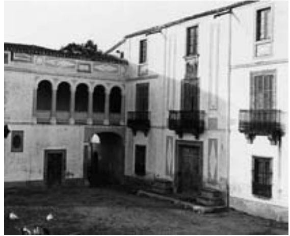
Figura 1. Foto de Can Pradell de la Serra (Vallgorguina) feta l'any 1918 per Antoni Gallardo i Garriga (Arxiu fotogràfic del Centre Excursionista de Catalunya).

va succeir, ja feia molts anys que s'havien publicat monuments megalítics d'altres països, de manera que alguns autors parlaven de Catalunya com un indret on no se n'havien construït mai. El menhir de la Pedra del Diable de Pau (Garrotxa) es donà a conèixer l'any 1872, així com també, durant el mateix any i en una altra publicació, el dolmen de Senterada (Pallars Jussà) esmentat per Moner (SANPERE i MIQUEL, 1881); es tractava dels primers monuments megalítics descrits del Principat. Dins del grup megalític del Maresme-Vallès Oriental, el dolmen de la Pedra Gentil de Vallgorguina es va publicar per primera vegada l'any 1878, mentre que els propers monuments megalítics de Pedra Arca (Vilalba Sasserra) i de Pins Rosers (Cardedeu) es van publicar al seu torn l'any 1879. Aquests vestigis del Vallès Oriental s'inclouen dins dels primers monuments megalítics