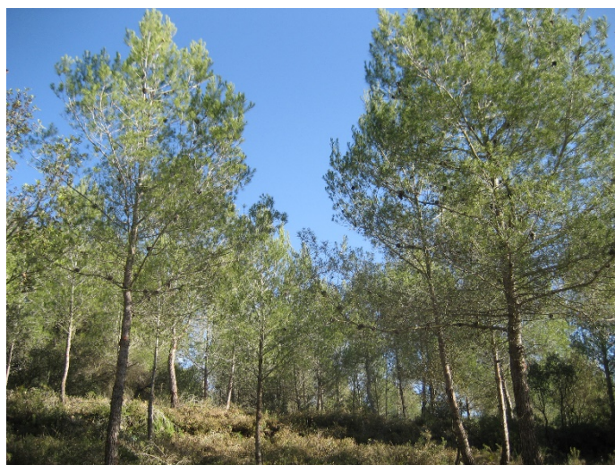
Figura 2. Pineda jove de pi blanc de regeneració natural de 30 anys abans (esquerra) i després (dreta) de l'aclarida de millora (aclarida de plançonada).