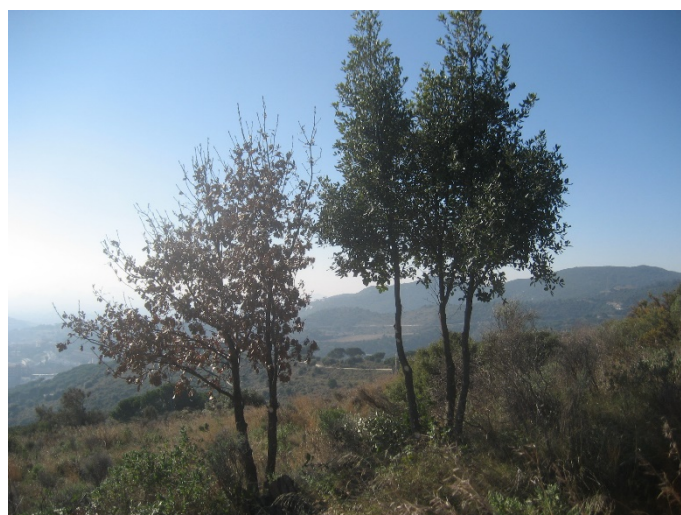
Figura 2. Bosc mixt de roure i alzina de regeneració natural de 16 anys amb densitat excessiva (esquerra); i selecció de tanyes de roure i alzina deixant dos o tres rebrotos en cada soca (potenciant la configuració com a arbre).