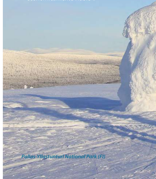
Pallas-Yllastunturi National Park (FI)

«El turismo sostenible en los espacios naturales protegidos europeos ofrece una experiencia valiosa y de calidad, protege los valores naturales y culturales, respalda la actividad económica local y la calidad de vida, y es económicamente viable».