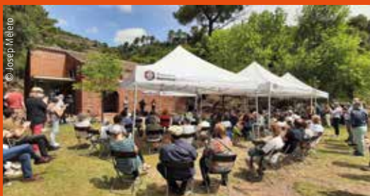
Inauguració de La Pahissa del Marquet

El centre cultural La Pahissa del Marquet. Arts – Lletres – Natura, és un espai pluridisciplinari que compta amb una programació estable d'activitats expositives, artístiques, literàries, musicals, formatives i lúdiques, dedicat a l'experimentació i a l'estudi de nous llenguatges que propicien les pràctiques híbrides. És un centre actiu per a la promoció, dinamització i organització d'activitats literàries, artístiques i educatives que també posin en relleu els valors culturals i naturals del Parc Natural de Sant Llorenç del Munt i l'Obac i de tot el seu context geogràfic.