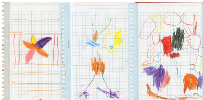
Dibuixos dels alumnes de l'Escola del Parc del Guinardó de Barcelona.