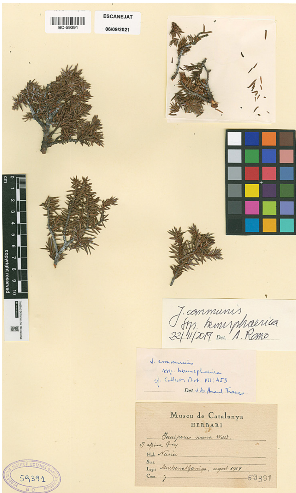
Figura 3. Plec de Juniperus communis ssp. hemisphaerica (BC 59301) recol·lectat a Núria (el Ripollès) per Montserrat Garriga, amb etiqueta manuscrita d'Oriol de Bolòs de la revisió feta per J. do A. Franco