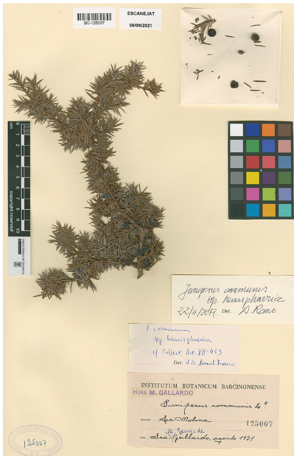
Foto: © Institut Botànic de Barcelona (CSIC - Ajuntament de Barcelona). Reproducció autoritzada.