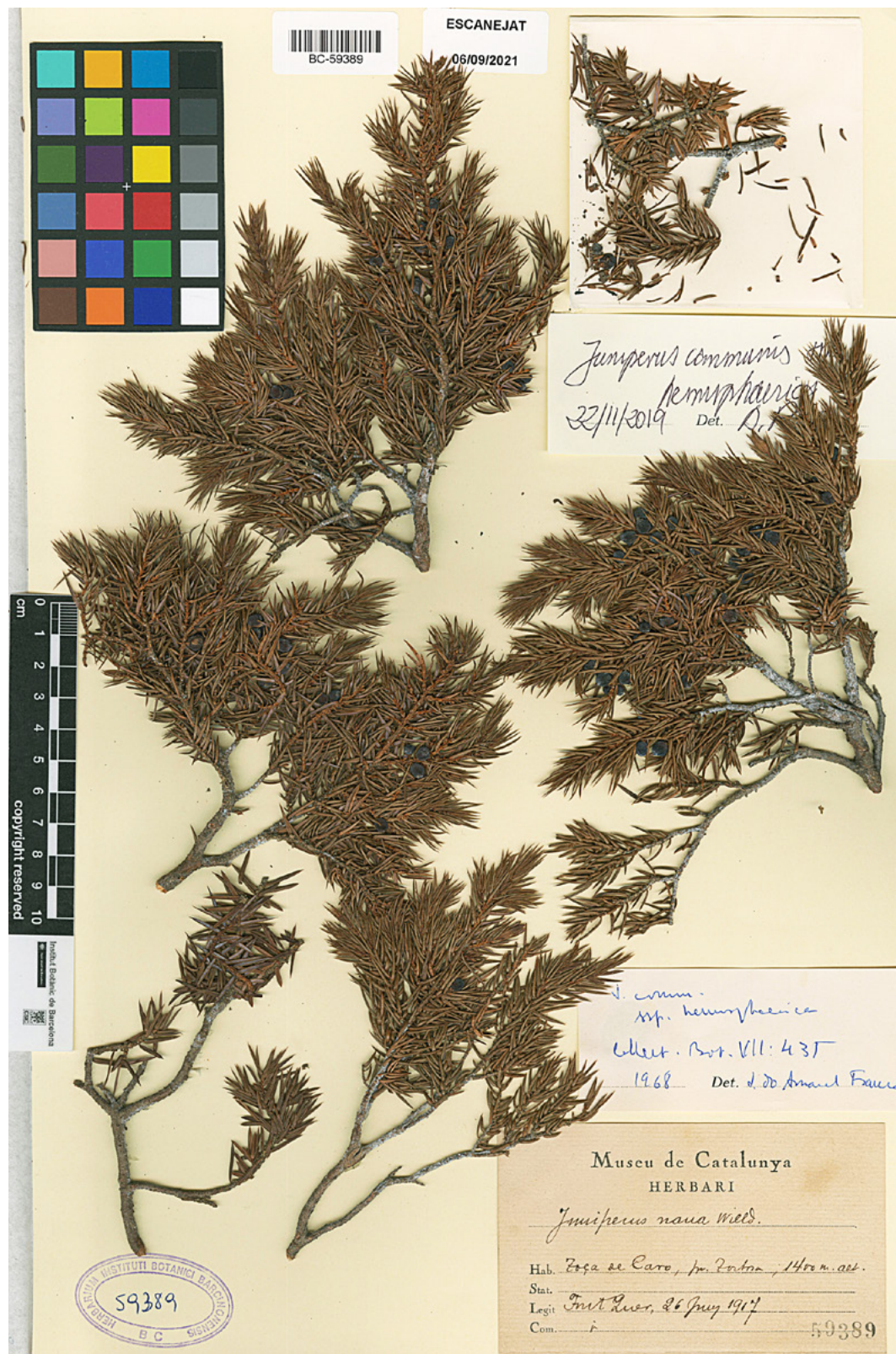
Figura 5. Plec de Juniperus communis ssp. hemisphaerica (BC 59389) recol·lectat al Caro (el Baix Ebre) per Pius Font i Quer, amb etiqueta manuscrita d'Oriol de Bolòs de la revisió feta per J. do A. Franco