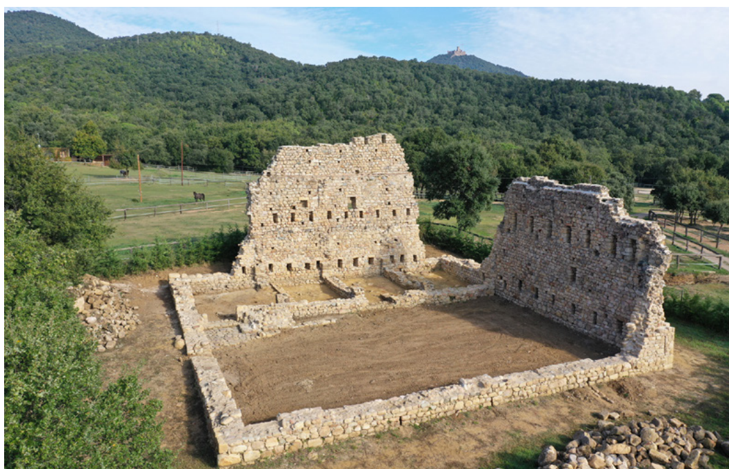
Figura 1. Vista general de la torre d'en Pega