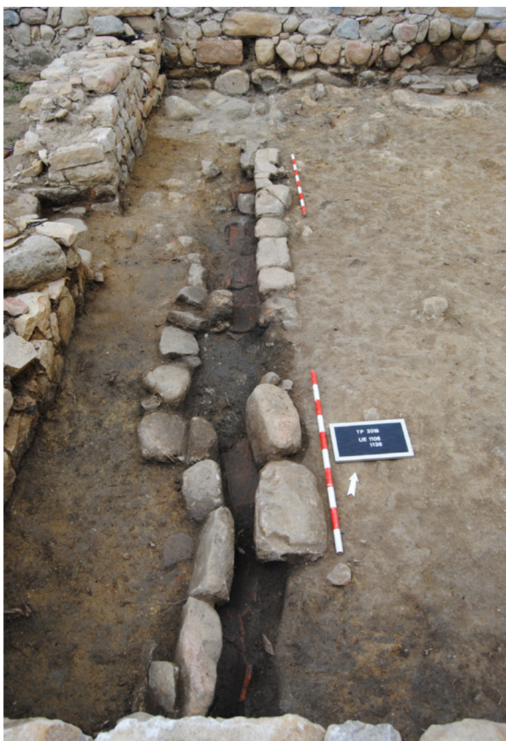
Figura 3. Imatge de la canal d'aigua dins de l'àmbit 1

Pel que fa als resultats arqueològics, cal esmentar que ha estat realment complicat establir una proposta cronològica clara per a la torre d'en Pega, atès que en termes de materials arqueològics ha estat realment pobra, però també degut a l'alt nivell d'espoli que ha patit l'edifici al llarg del temps.