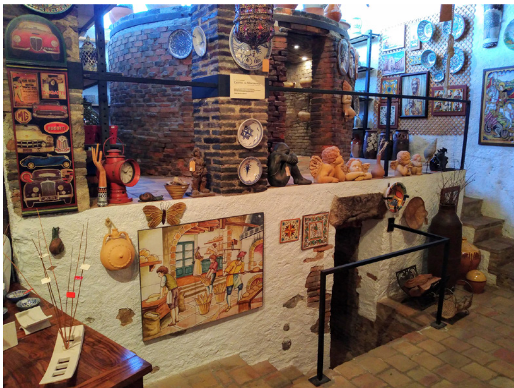
Figura 13. Imatge de l'interior de la botiga Terraforta, emplaçada en un antic obrador terrisser. S'hi conserva el forn morú que havia tingut

Així, es va conèixer quan aixecaren persianes els primers comerços (a la meitat dels anys seixanta del segle XX; fins aleshores, qui volia comprar res anava directament a l'obrador terrisser), si estaven vinculats o no amb obradors i indústries, quins foren els moments de creixement i davallada, quins canvis han experimentat aquests establiments pel que fa a allò que ofereixen per tal de poder continuar oberts (ampliació de l'oferta de productes no terrissers o ceràmics posats a la venda, presència o no en les xarxes socials i venda o no a través d'aquestes xarxes), com ha evolucionat la tipologia dels seus clients, etc.