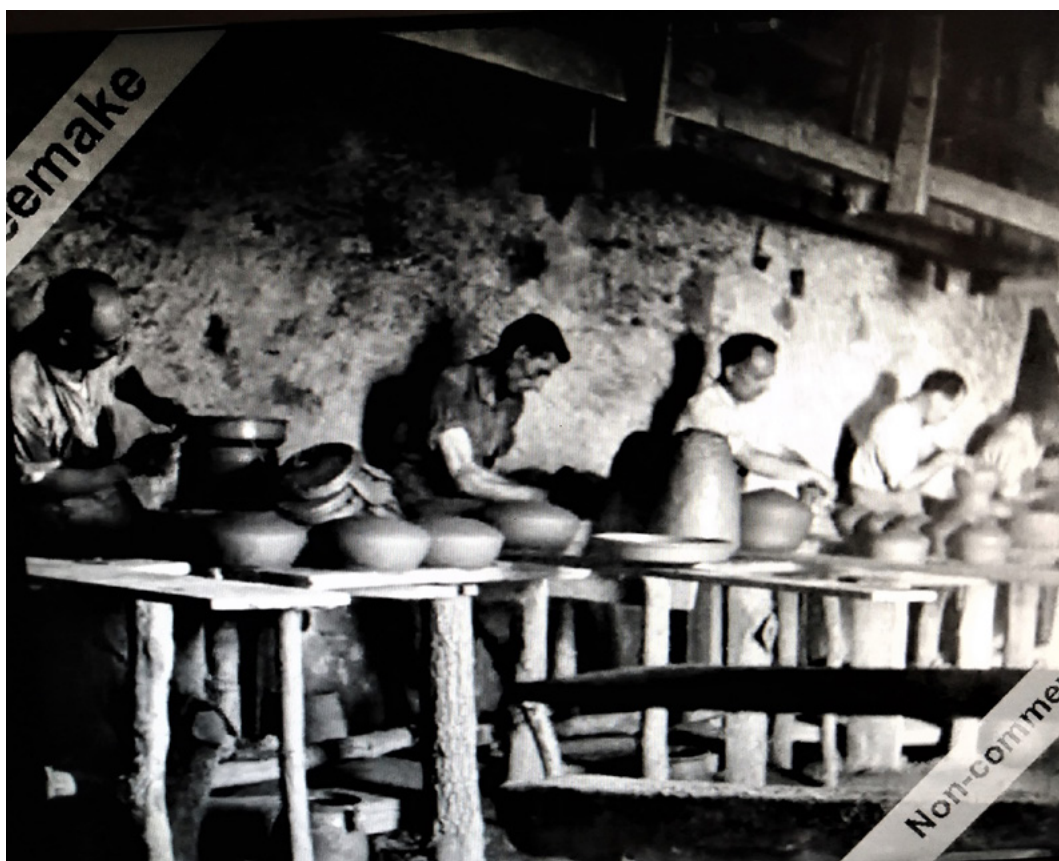
Figura 5. Imatge extreta del documental