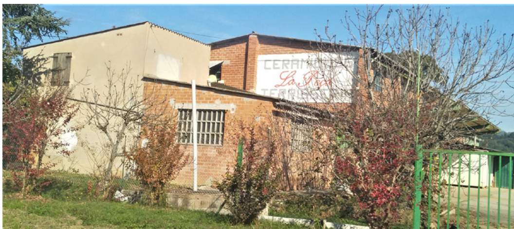
Figura 9. Imatge d'una de les indústries terrisseres estudiades: La Peça

Treball sobre l'actual indústria terrissera bredenca. Elaborat l'any 2020 a proposta del Museu Etnològic del Montseny La Gabella, d'Arbúcies, va permetre aproximar-se a la transformació que ha experimentat l'elaboració de terrissa a Breda en les darreres dècades, en el transcurs de les quals els canvis que s'han donat en aquest àmbit terrisser han estat molt importants i accelerats. Malgrat que no va ser possible estudiar totes les indústries, aquest treball va possibilitar conèixer l'evolució i moment present tant d'una petita indústria com d'un gran fabricant. A més, la recerca en l'arxiu d'una d'elles va aportar la descoberta d'informacions fins aleshores desconegudes: per exemple, l'existència d'un moviment obrer terrisser en els anys de la Segona República Espanyola, agrupat, en part o totalment (això es desconeix), en el sindicat local Unión General de Alfareros.