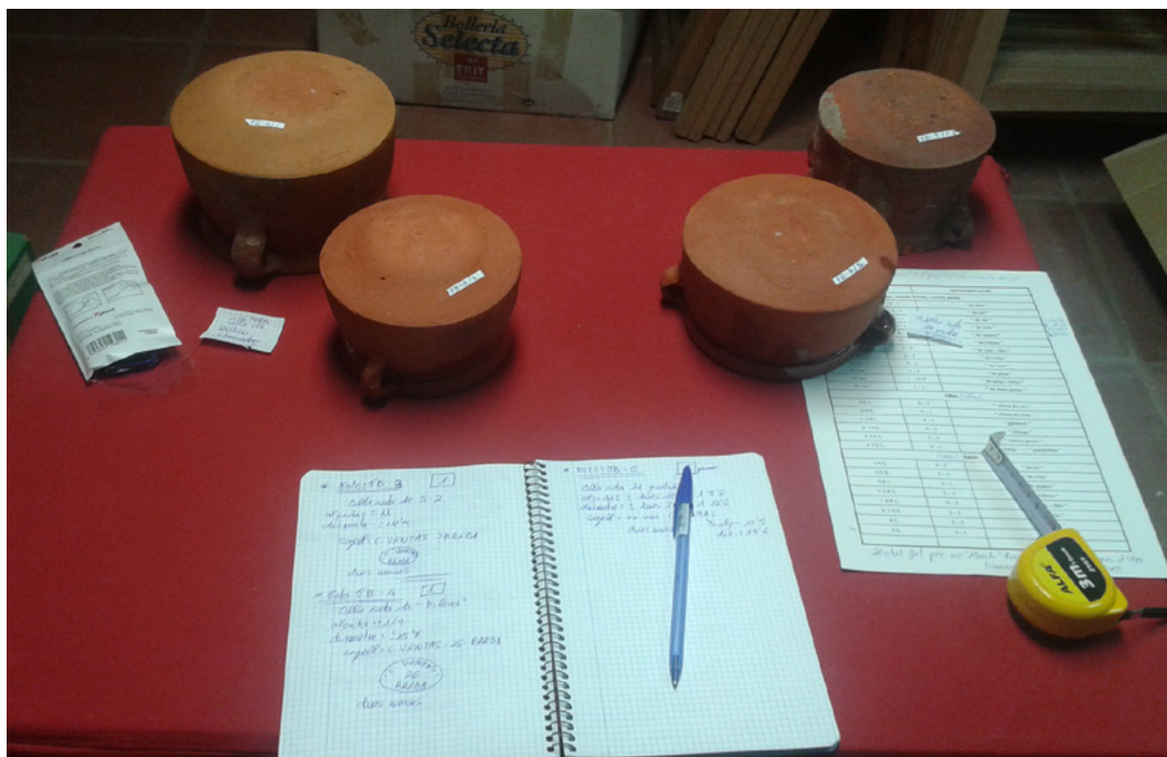
Figura 7. Imatge d'un moment de la documentació de les peces