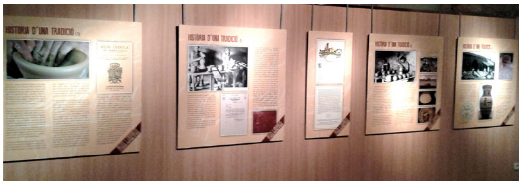
Figura 3. Imatge de l'exposició a Arbúcies