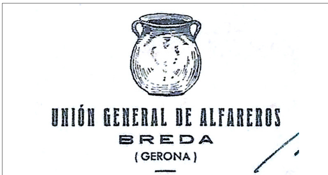
Figura 11. Logotip del sindicat terrisser al qual es fa referència en el text. Localitzat a l'arxiu de l'empresa Cerámicas Regàs