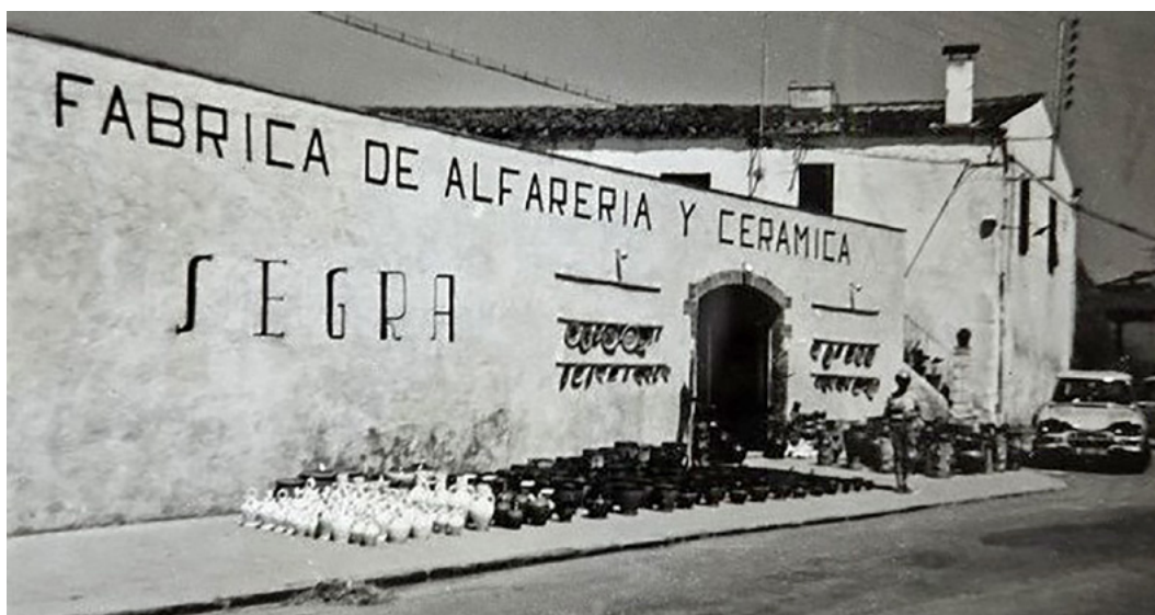
Figura 12. Fotografia d'una de les primeres botigues de terrissa i ceràmica de Breda, possiblement feta entre mitjan anys seixanta i la primera meitat del setanta del segle xx