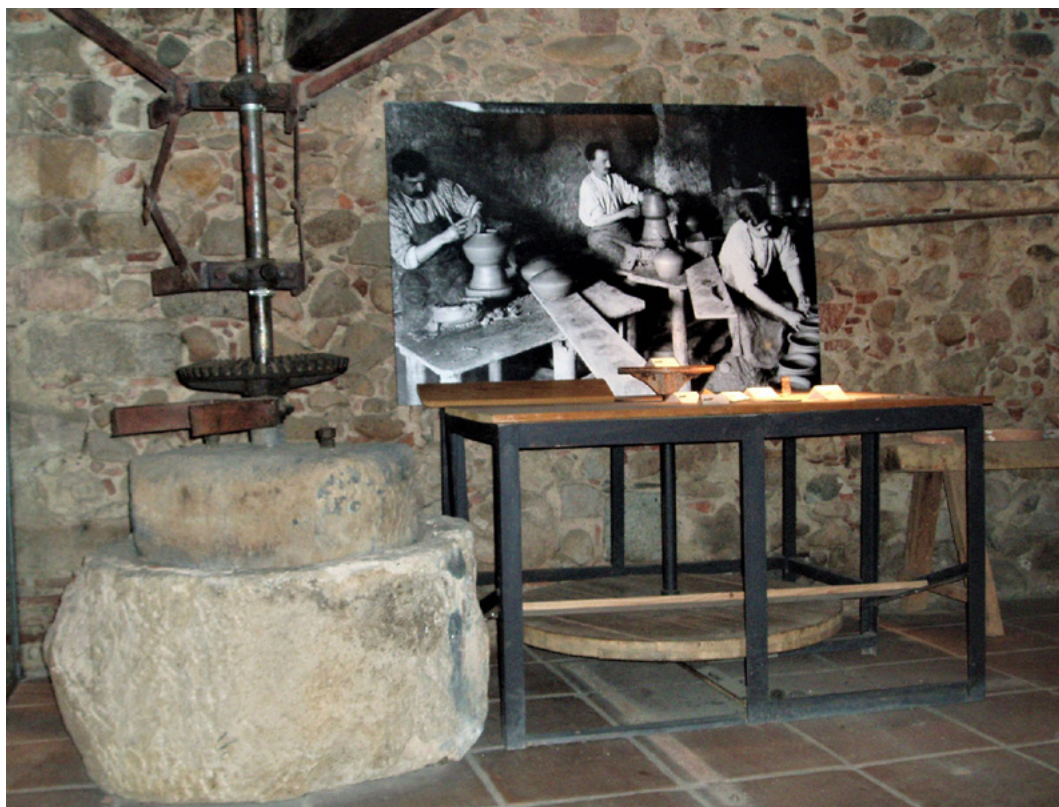
Figura 2. Imatge de l'exposició a Bredà