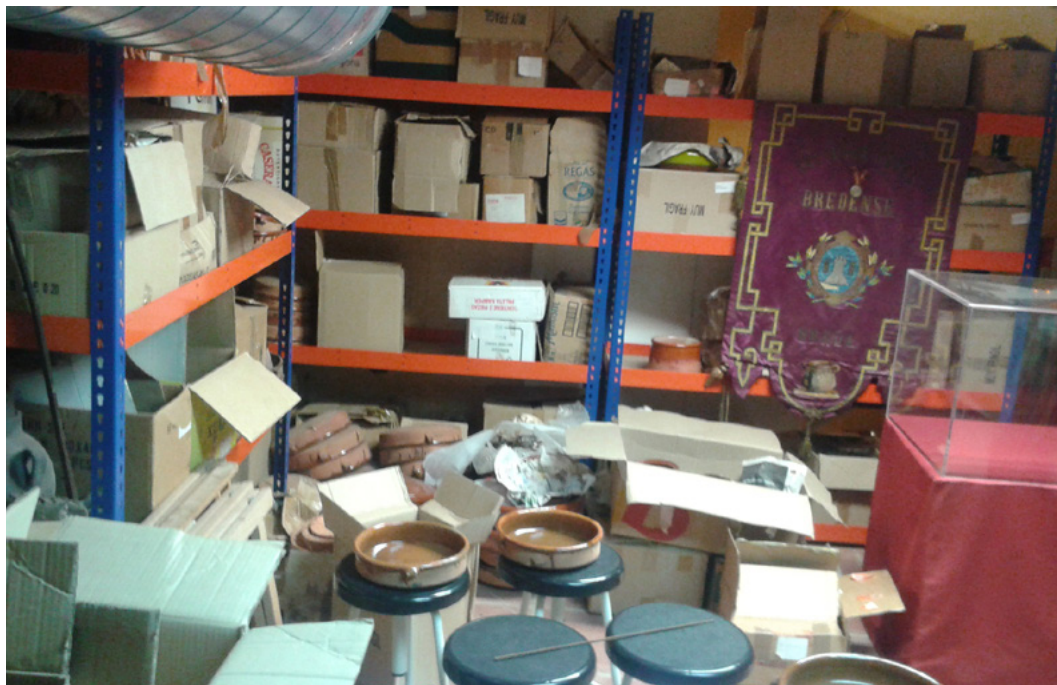
Figura 6. Imatge prèvia a l'inici de l'inventari

La realització d'aquest inventari, que va comptar amb l'ajuda de terrissers locals, també va permetre aprofundir en el coneixement del vocabulari terrisser i en el sistema envitricollat que regia i designava cadascun dels atuells fets en un obrador.