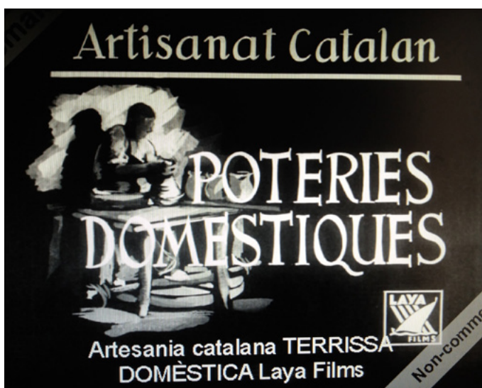
Figura 4. Imatge extreta del documental

Localització, restauració i exhibició del documental Ollaires de Breda . Produït l'any 1937 per Laya Films, productora creada per la Generalitat republicana, i dirigit per Ramon Biadiu, mostra tot el procés terrisser que aleshores tenia lloc a Breda (procés que, amb canvis mínims, era el mateix que se seguia des de feia segles). Aquest és un documental donat per perdut durant anys però del qual se saben totes les característiques, i feia temps que se'n cercava una còpia (per part d'uns bredencs des de l'any 2000!). Gràcies a una recerca que Esteve Riambau, actual director de la Filmoteca de Catalunya, feia sobre aquella productora, el 2016 es va localitzar una còpia de la versió en francès a la Cinémathèque Française de París (aquest documental va tenir versió en català, castellà i francès). La Filmoteca de Catalunya en va restaurar la còpia i en va donar a conèixer l'existència, i després de diverses gestions, se'n pot veure una còpia subtítulada en català a l'espai Els Forns de Breda des de l'octubre del 2017. Constitueix un document de gran importància per a la història terrissera de Breda.