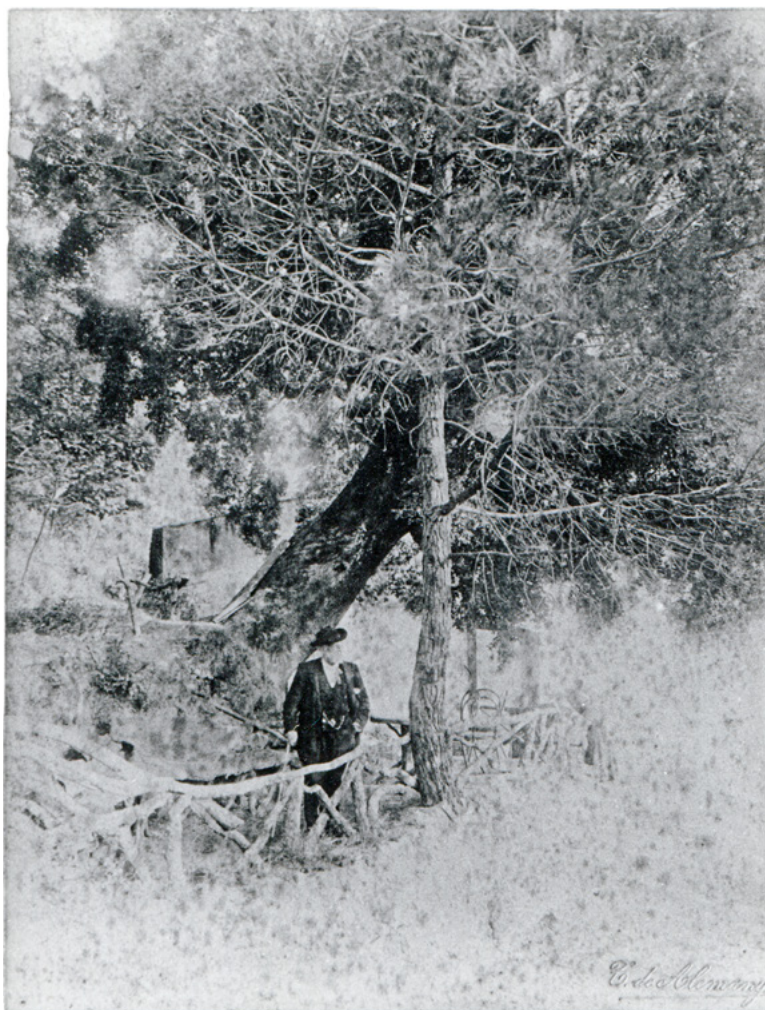
Figura 4. Víctor Balaguer sota l'alzina centenària de Can Blanc d'Arbúcies, 1898