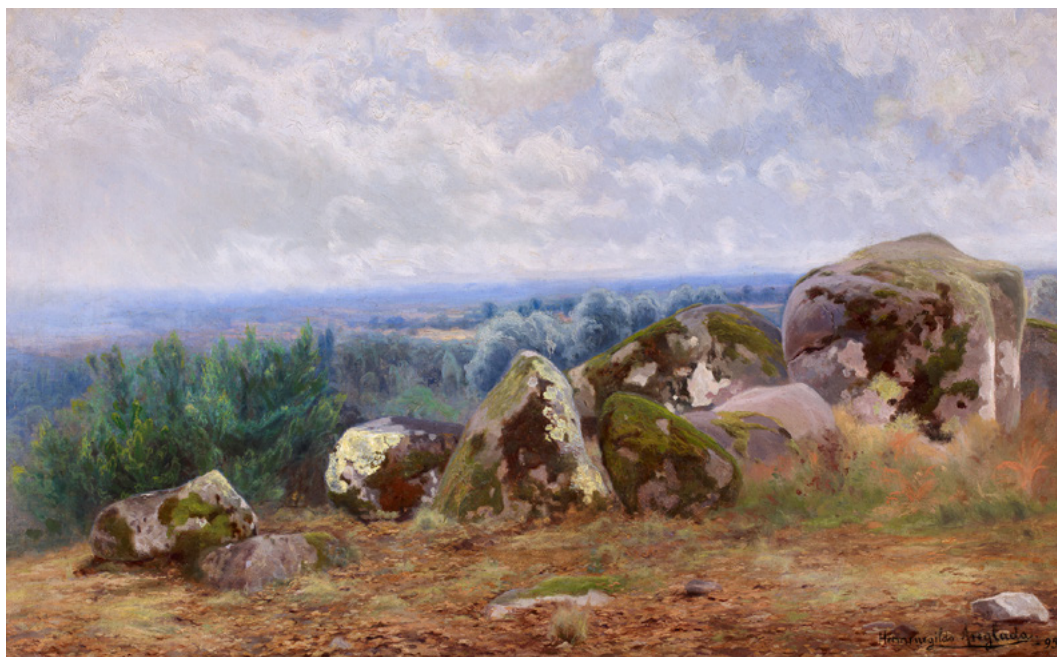
Figura 6. Hermen Anglada, Paisatge amb roques, 1893. Col·lecció d'art de Crèdit Andorrà, Andorra la Vella

Foto: Jaume Blassi. © Hermen Anglada-Camarasa, VEGAP, Girona, 2022.