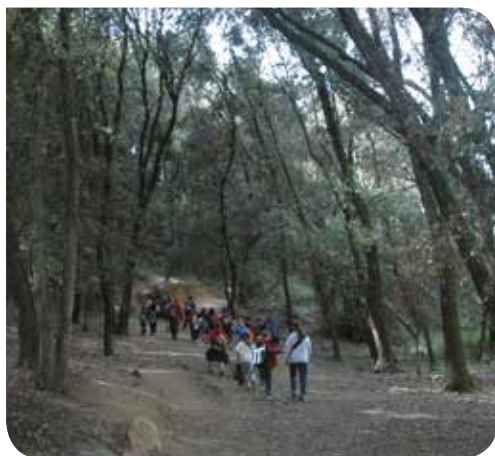
J. Hernández (Arxiu XPN)

Informació i inscripcions: EducaViladrau, tel. 619 369 081 i 670 224 649, educa@educaviladrau.com