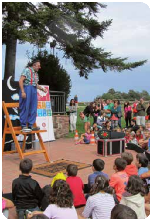
J. Melero (Arxiu XPN)

8a Caminada Solidària contra la violència de gènere «Els entorns de Viladrau». L'organitza: Associació de Dones de Viladrau. Més informació: donesdeviladrau.blogspot.com.es