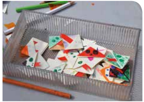
J. Melero (Arxiu XPN)

Servei de Medi Ambient Pujada de Sant Martí, 5 17004 Girona Tel. 972 185 000 medi.ambient@ddgi.cat