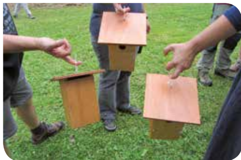
J. Melero (Arxiu XPN)