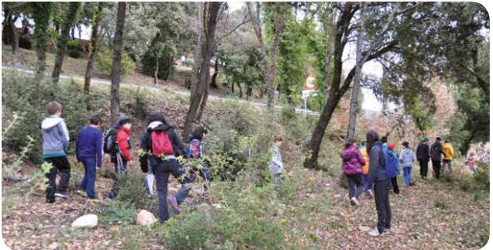
J. Melero (Arxiu XPN)

Viu el parc és una oportunitat excel·lent per conèixer i descobrir el patrimoni natural i cultural, així com tots els racons del Parc Natural del Montseny. Esperem que gaudiu molt del parc, del seu patrimoni i del contacte amb la natura!