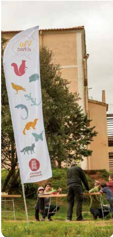
© Pep Herrera (Taller de Cultura)