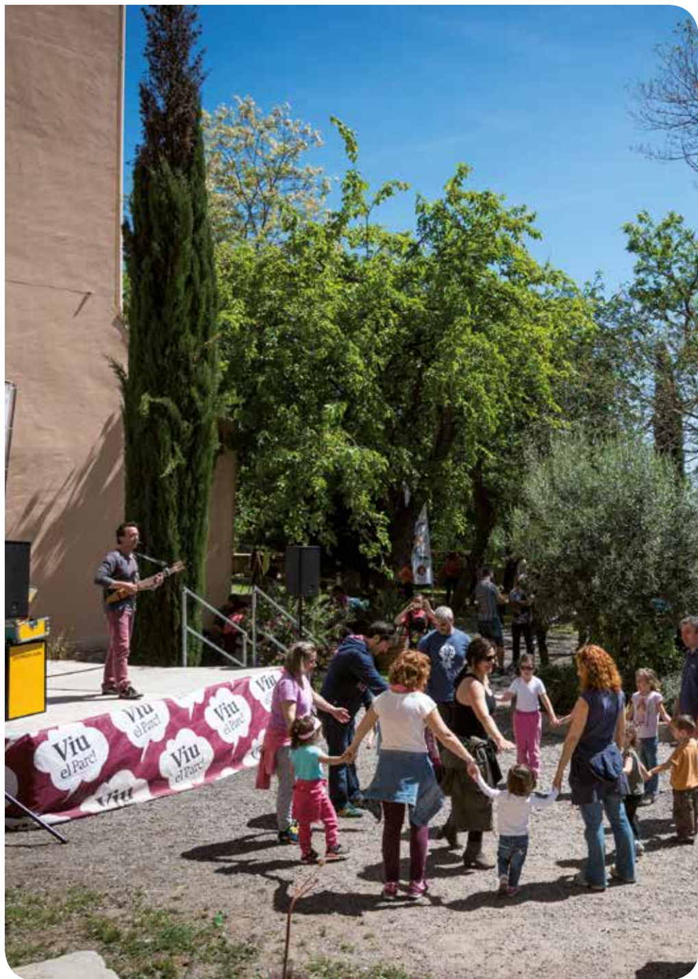
Pepo Herrero (Taller de Cultura)