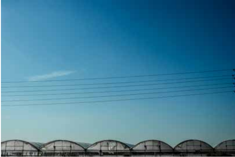
Ángela Balaguer / Travesía / 2014