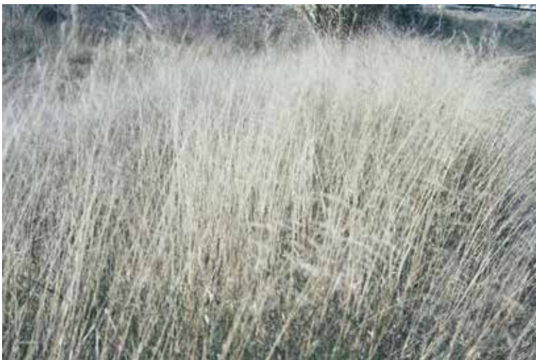
Sara Cabo / Decurs, I / 2014