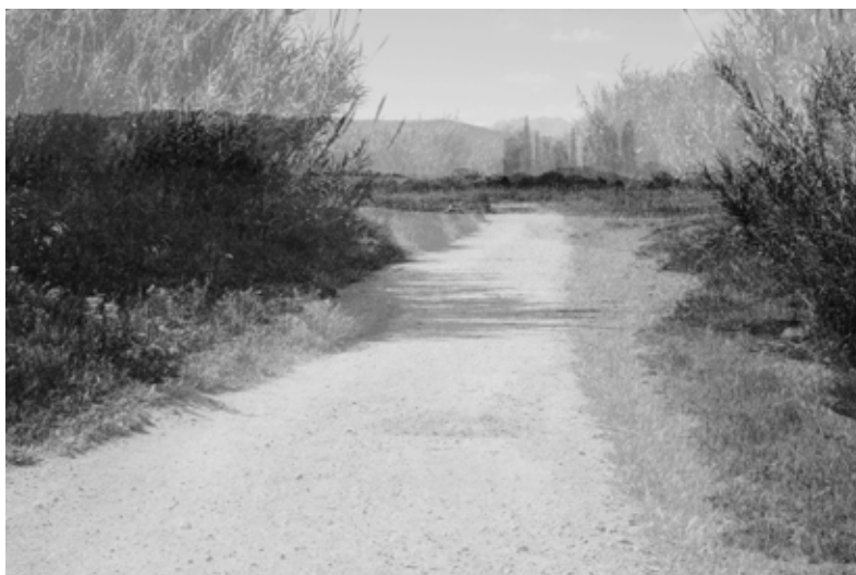
Clara Vieira / A rua / 2014