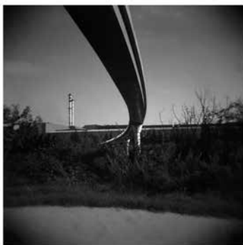
Carlos Vásquez / Baix Llobregat [Serie nº 1] / 2014