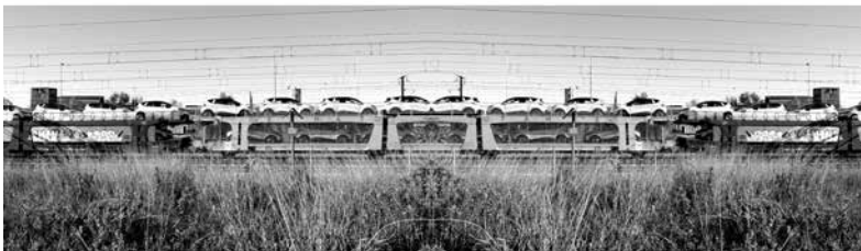
Berta Esteve / Utopía / 2014