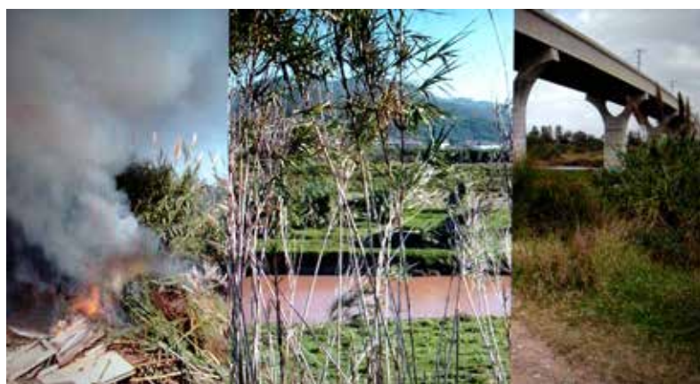
Jeff McCreight / Baix LlobreGIF / 2014