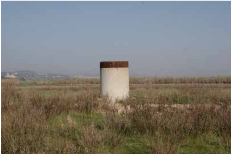
Anna Celda / Ciutats inalterables / 2014