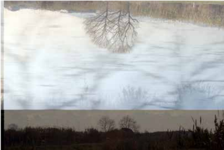
Marina Riera / Escenes grises / 2014