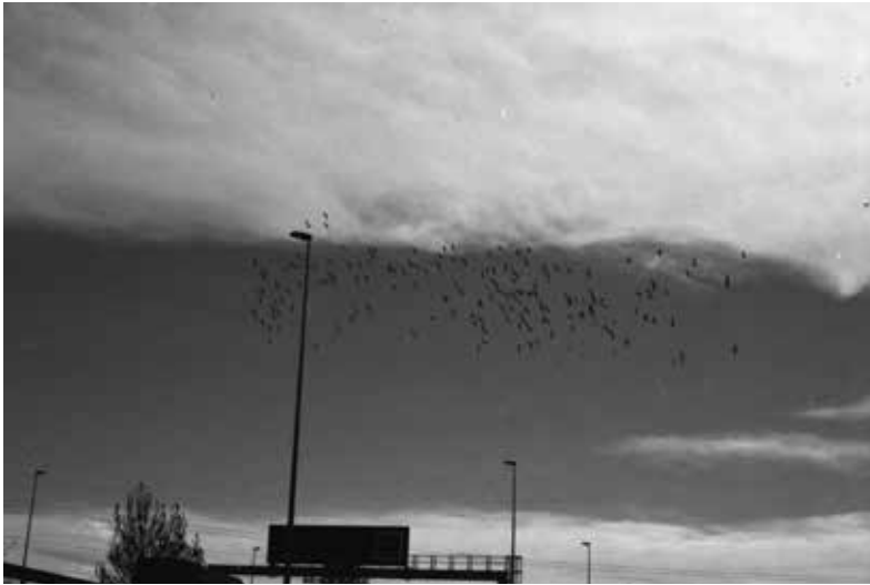
Sabina Vilagut / El paisatge fragmentat / 2014