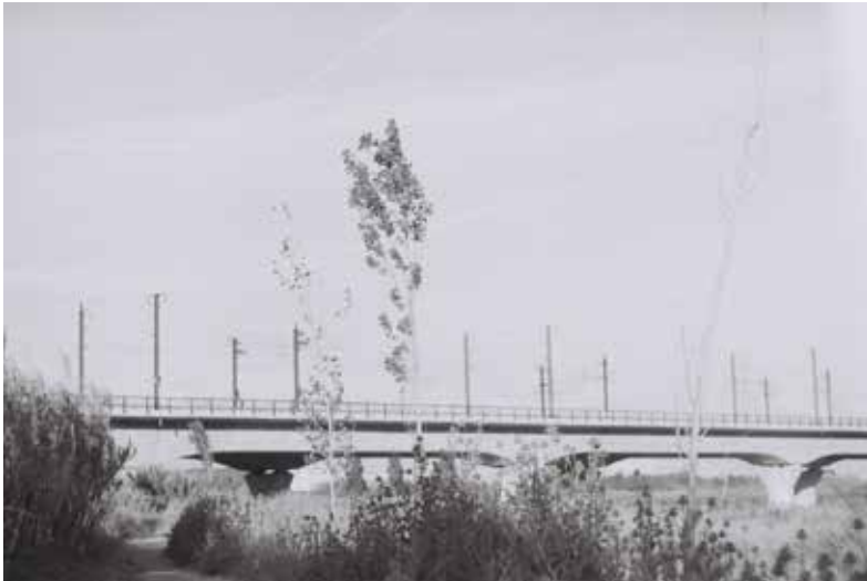
Magda Vaz / Símbolos naturales / 2014