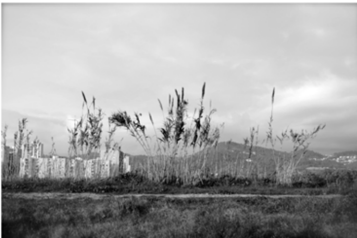
Mingzi Xu / La gran obra / 2014