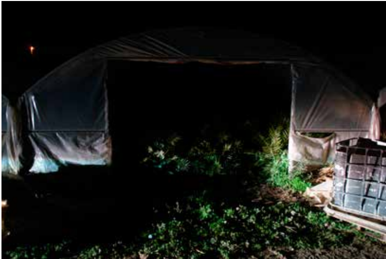
Joaquim Espuny / Sense títol / 2014