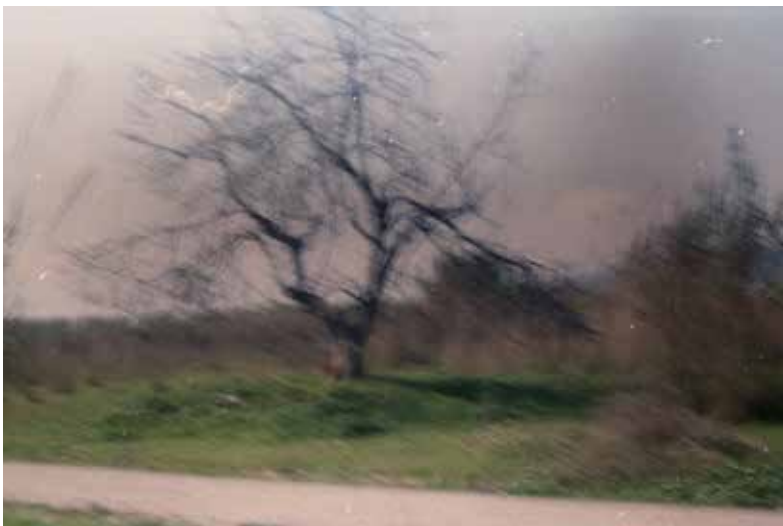
Ana Kvirikashvili / La ferida del lloc / 2014