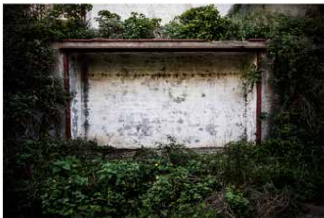
Iana Soares / Tengo que irme / 2014