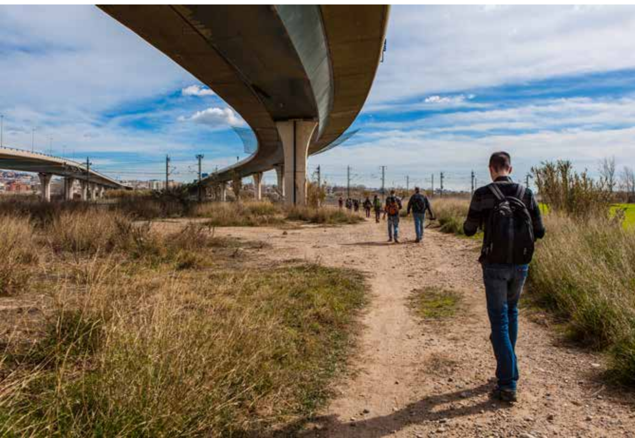
Alumnes de Grau i Màster - Facultat de Belles Arts