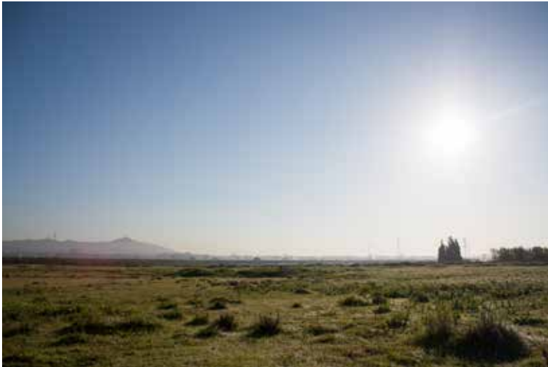
David Amores / Ubi sunt / 2014