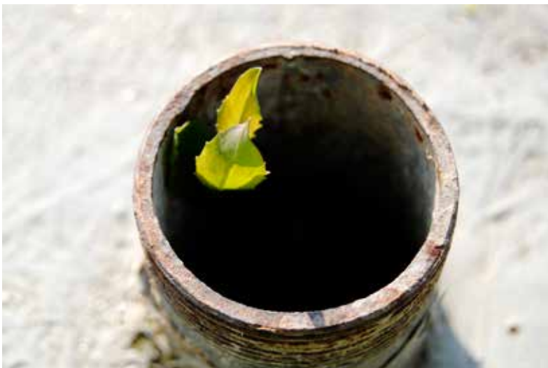
Fanny Duroux "Naturam expelles furca, tamen usque recurret" / 2014