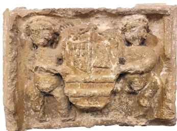
Escudo de los Besora