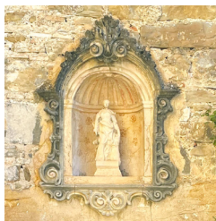
Capilla de Santa Bárbara

El señor de Besora lucha para mantener su poder en un Bisaura desigual y cambiante.