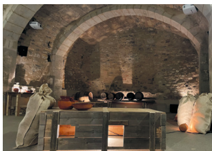
Escenografía medieval en la sala de la bodega

El feudalismo en El Bisaura consolida a los Besora como grandes señores de un sistema que somete a los campesinos bajo su poder.