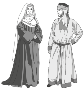
Gombau de Besora y Ermessenda de Carcassona, protagonistas de la Alta Edad Media

La torre de defensa sobre el río Ter se levanta bajo la vigilante mirada del gran castillo de Besora.