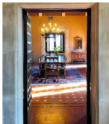
Salas nobles del castillo

Los tiempos cambian y la nobleza da paso a una poderosa burguesía comercial e industrial. El castillo de Montesquiu, capricho y dispendio de los herederos Juncadella.